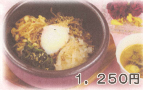
石焼ビビンバ (スープ・デザート付)