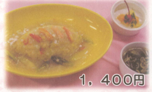
カニあんかけチャーハン (スープ・デザート付)