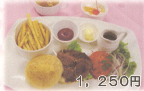
アイランドオリジナル 那須バーガープレート (ステーキバーガー・スープ・ポテトフライ付)