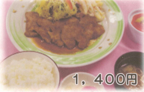
しょうが焼き御膳 (ご飯・味噌汁・香の物・デザート付)