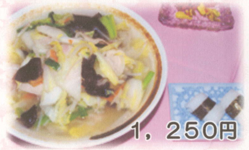
野菜たっぷりタンメン (餃むすび付)