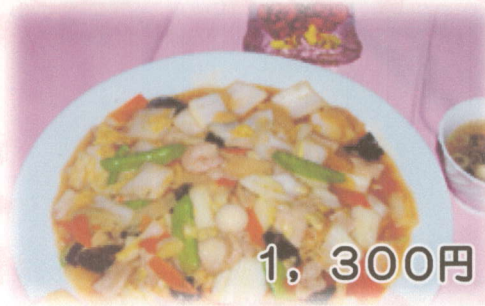
五目あんかけ焼きそば (スープ付)