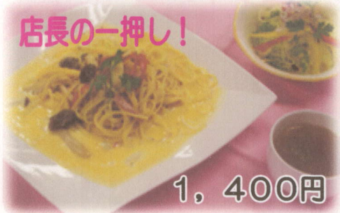
春のパスタランチ (季節のパスタ・スープ・サラダ・デザート付)