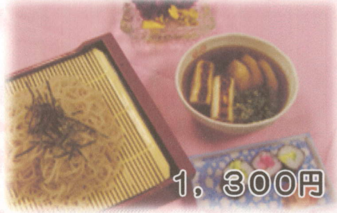
鴨南蛮せいろそば 又は うどん (細巻き・香の物・デザート付)